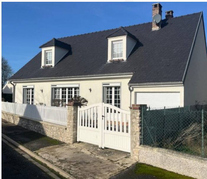
Pavillon 3 chambres à CHENOISE- 279 000 €

Située à Chenoise dans un environnement calme, cette maison propose un agencement pensé pour le confort familial. Le rez-de-chaussée s'ouvre sur un vaste séjour agrémenté d'une cheminée, offrant un espace de vie chaleureux et lumineux propice aux moments conviviaux. La cuisine indépendante, entièrement équipée, donne directement sur une terrasse. Le rez-de-chaussée rassemble également des pièces fonctionnelles très recherchées : 1 chambre, 1 salle de bains avec WC séparé, et 1 grande pièce technique de 15,9 m 2 équipée d'un poêle à granulés - aménagée en buanderie-cellarier et rangements, elle comprend en outre une douche. La véranda complète cet ensemble en apportant une atmosphère baignée de lumière, idéale pour la détente toute l'année.